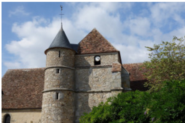
^ Église Saint-Eutrope