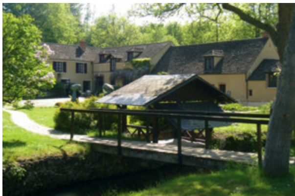
^ Maison Elsa Triolet - Aragon