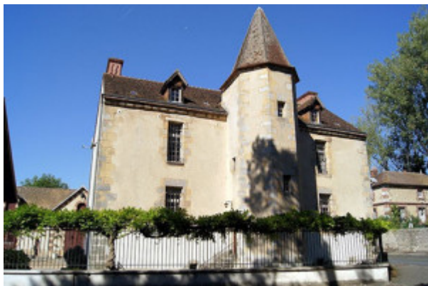
^ Manoir de Sainte-Mesme