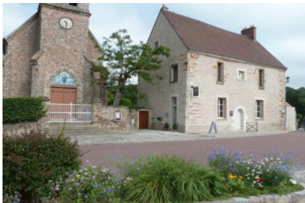
^ Manoir des Arts