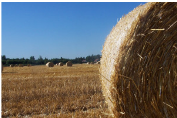
Schéma de Cohérence Territoriale

Apparu avec la loi Solidarité et Renouvellement Urbain (SRU) du 13 décembre 2000, le Schéma de Cohérence Territorial (SCoT) est un document d'urbanisme et de planification stratégique à l'échelle intercommunale.